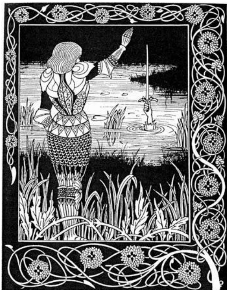
Octubre 2017 Portada y contratapa, Aubrey Beardsley Licencia Creative Commons Santiago de Chile