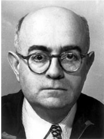
producciones artísticas Teodoro Adorno

Teodoro Adorno temía que en el futuro –nuestro presente–, la expresión cultural y artística estuviera dominada por la producción seriada de la industria cultural, dejando a la comunidad a merced de los poderes tanto fácticos como políticos en cuanto a la producción de sus esferas imaginarias y simbólicas. Lamentablemente, aquello ha ocurrido en gran medida. Sin embargo, la comunidad organizada también ha sido