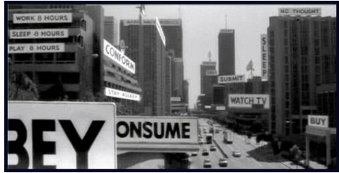
Fotograma de la película "They Live"

revista gratuita disponible tanto en formato digital como impreso y difunde contenidos literarios tanto populares como, a veces, de autores consagrados, generando con esto un debate de altura y constituyéndose